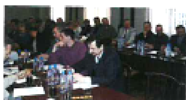
Walne Zebranie Delegatów -przebieg obrad i wyniki wyborów

CO DALEJ Z ... KODEKSEM PRACY ? /akcja protestacyjna NSZZ "Solidarność"/