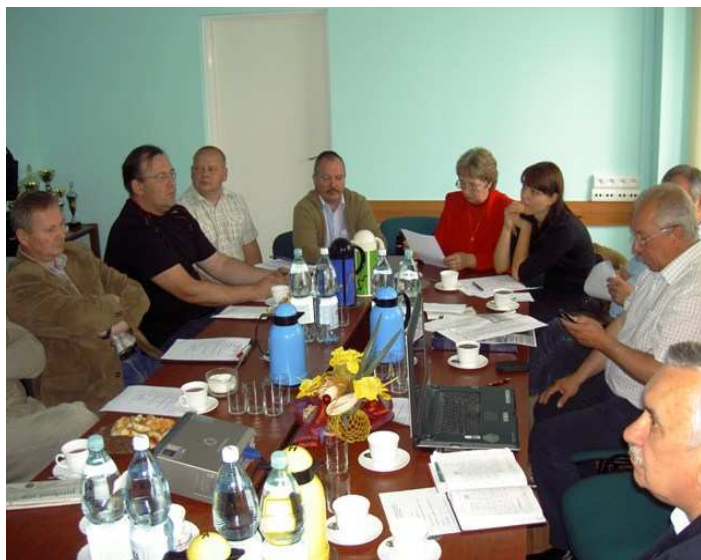
Członkowie KP NSZZ „S” Gorzów Wlkp.

W Międzychodzie na wyjazdowym posiedzeniu obradowała Komisja Podzakładowa NSZZ Solidarność Enea Oddział Gorzów Wlkp.