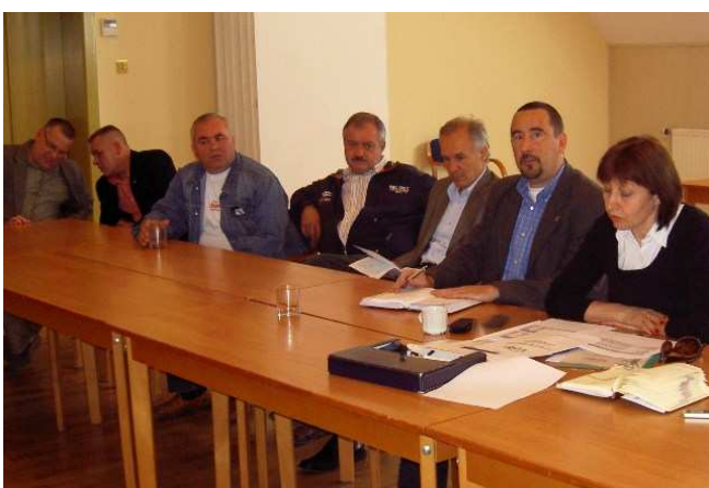
Przedstawiciele Gorzowa w MK NSZZ „S” Enea

W Gronowie obradowała Międzyzakładowa Komisja NSZZ Solidarność Enea.