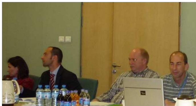
Członkowie zespołu ds. ubezpieczeń

Na następnym spotkaniu, po przeanalizowaniu poprawionych ofert zostaną wyłonione do ostatecznych rozmów dwie najlepsze firmy zarówno oferujące ochronę ubezpieczeniową, jak i ochronę zdrowotną.