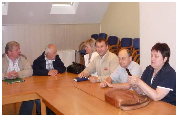
Przedstawiciele Szczecina w MK NSZZ „S” Enea

W Gronowie obradowała Międzyzakładowa Komisja NSZZ Solidarność Enea.