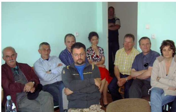
Załoga Rejonu Dystrybucji Międzychód

Po zakończeniu obrad Komisji Podzakładowej doszło do spotkania członków Prezydium i Rad Nadzorczych z załogą Rejonu Dystrybucji Międzychód. W spotkaniu uczestniczyła liczna reprezentacja załogi zatroskana o losy swoich miejsc pracy. Główne tematy posiedzenia to :-drugi etap prywatyzacji Enea –zagrożenia z tym związane, -akcje pracownicze, - polityka płacowa.