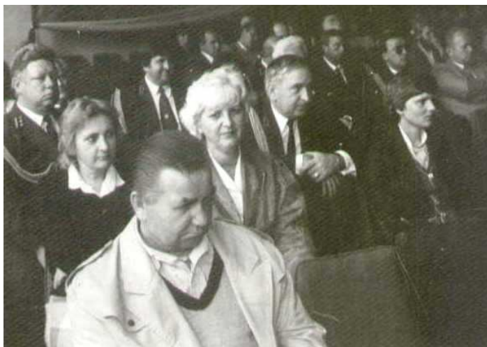
Lata 80-te akademia z okazji Dnia Energetyka