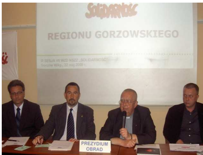
Prezydium WZD ZR Gorzowskiego NSZZ „S”

W hotelu „Mieszko” spotkali się na corocznym zjeździe delegaci NSZZ Solidarność Zarządu Regionu Gorzów Wlkp.