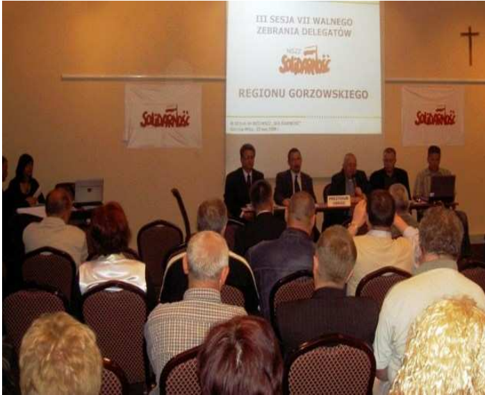
Sala obrad WZD NSZZ „S” ZR Gorzów Wlkp.

Walne Zebranie Delegatów w pełni popiera wszelkie akcje protestacyjne, w tym strajk generalny mający na celu powstrzymanie procesu dalszej prywatyzacji. Obligujemy Komisję Krajową i Zarząd Regionu do udzielenia wsparcia.