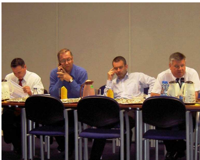
Zarząd Enea Operatora

W Poznaniu doszło do spotkania stron dialogu społecznego w Enea Operatorze.